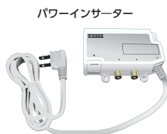
パワーインサーター

お客さま宅内に設置しているパワーインサーターやeo光テレビチューナーの電源プラグ、または各ケーブルが抜けていないかご確認ください。 きちんと接続されていた場合は、パワーインサーターの電源プラグをコンセントから抜き差ししてみてください。